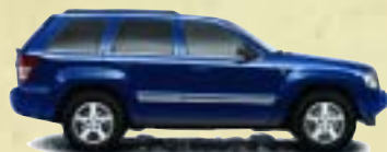
Patriot Blue Metallic