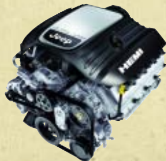
Der 5.7 l-V8-HEMI-Benzinmotor.