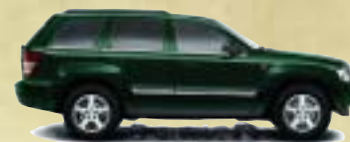
Deep Beryl Green Metallic