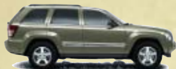
Light Khaki Metallic