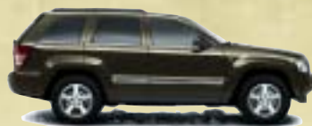
Dark Khaki Metallic