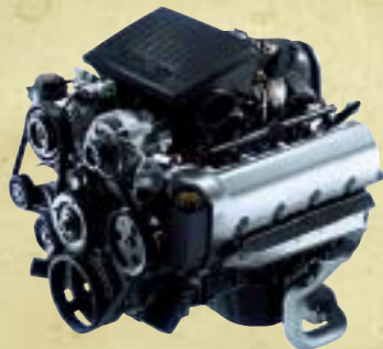
Der 4.7 l-V8-Benzinmotor.