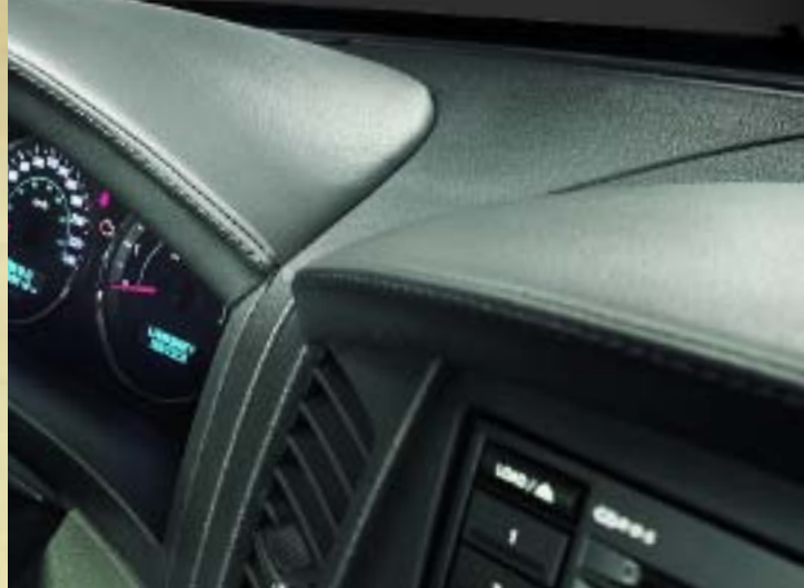
Lederapplikationen am Armaturenbrett