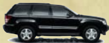
Brilliant Black Crystal Metallic