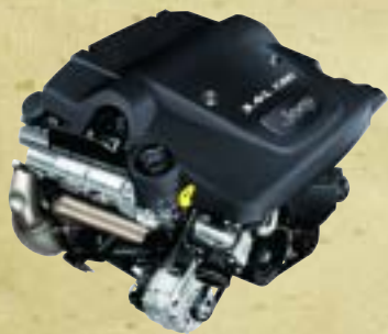
Der 3.0 l-V6-Common Rail Dieselmotor.

einer einzigen Tankfüllung bis zu 900 Kilometer zurücklegen kann. Oder der kultivierte 4.7 l-V8-Benzinmotor, der bei aller Leistungsstärke durch herausragend niedrige Geräuschentwicklung besticht. Besonders eindrucksvoll ist der 5.7 l-HEMI-V8-Motor. Und das nicht nur wegen seiner enormen Kraft. Denn sein modernes Multi Displacement System (MDS) gibt ihm die Möglichkeit, vier der acht Zylinder bei entsprechender Fahrweise abzustellen, was eine Kraftstoffersparnis von bis zu 20% mit sich bringt. Aber egal, für welche Motorvariante Sie sich entscheiden, und egal, ob Sie auf oder abseits der Straße unterwegs sind: Mit dem neuen Jeep® Grand Cherokee beeindrucken Sie überall.