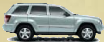
Bright Silver Metallic