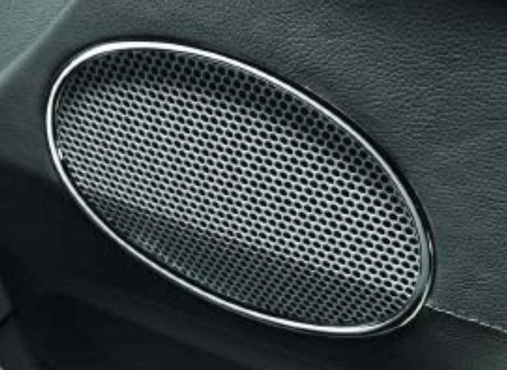
Lautsprechereinfassungen in Chrom