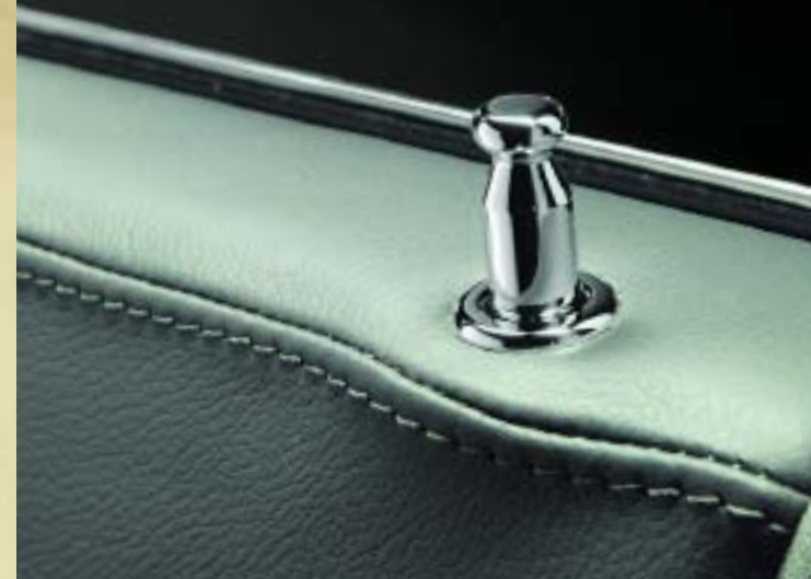
Türstifte in Chrom