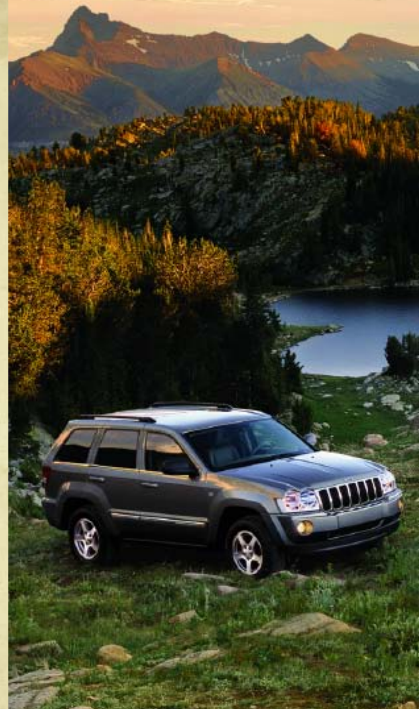
Der Jeep® Grand Cherokee Limited in Graphite Metallic.